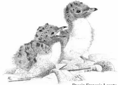
Dessin François Lovaty

Reproduction of the Common Tern Sterna hirundo in a habitat seriously disturbed by helicopter landings and predation: Antwerp, left bank of the river Scheldt, 1976-2007. Between 1976 and 2007, nesting pairs of common terns and the number of fledglings per pair were counted on the left bank of the Scheldt. Between 1991 and 1997, helicopter landings caused serious disturbance in the colonies. Disturbance of nesting colonies by air-traffic landing is not well documented. Here the landings took place two or three days per week during each nesting season, at a rate of one to five per day. Out of 33 landings observed, 14 took place at less than 400 metres from the edge of the tern colonies. The shorter the distance between the landing spot and the edge of the colonies, the longer it took for the adults to return to the nest. It seemed likely that the breeding birds would become acclimatised to the landings. Despite these repeated disturbances, the Common Terns remained faithful to their nesting site, despite significant relocations of the