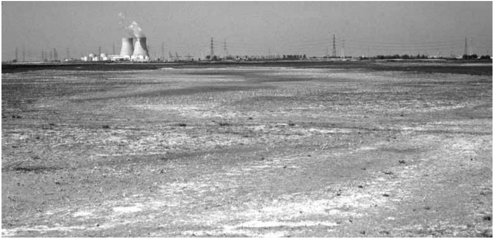
PHOTO 1. — Lieu initial de nidification de la Sterne pierregarin Sterna hirundo , Deurganckdok, rive gauche de l'Escaut au Nord d'Anvers, 1984.

Initial breeding site of the Common Tern Sterna hirundo at the Deurganckdok on the left bank of the river Scheldt north of Antwerp, 1984.