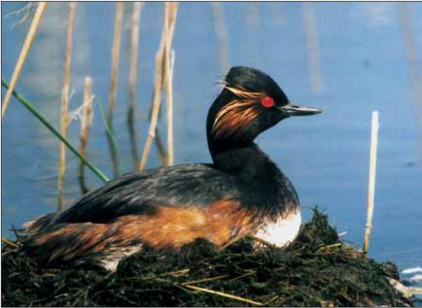
Geoorde Fuut Podiceps nigricollis

enige zekere kenmerk betreft het ontbreken of het zichtbaar onvolgroeid zijn van de slagpennen bij het uitslaan van de vleugels. Maar de waarde van dit kenmerk blijft ook beperkt, vermits vleugelflappen niet frequent voorkomt. Daarom blijft het moeilijk het aantal vogels in slagpenrui benaderend te bepalen op afstand.