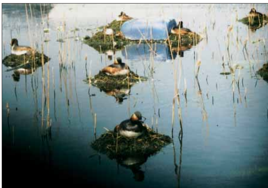
Deel van een broedkolonie van de Geoorde Fuut Podiceps nigricollis , nesten nagenoeg zonder dekking. Hooge Maey, juni 1999.

Ook de broedvogelpopulatie steeg gevoelig in het beschouwde gebied tijdens de afgelopen jaren: van 46 paren in 1983 tot 71 - 77 paren in 1996. Vanaf dat jaar deed zich een belangrijke verschuiving voor van de broedvogels vanuit de Kempen naar het Antwerpse havengebied. In die beweging speelde de plas 'Hooge Maey' (Oorderen, Rechteroever van het Antwerpse havengebied) een voorname rol. Hier kwamen ruim 60 paren tot broeden in 1996 en 1997 en 71 in 1999. In de periode 2000 - 2005 daalde de broedvogelpopulatie over het gehele beschouwde gebied sterk, met uitersten van 13 en 33 - 48 broedparen in respectievelijk 2001 en 2003 (Maes en Voet 2005).