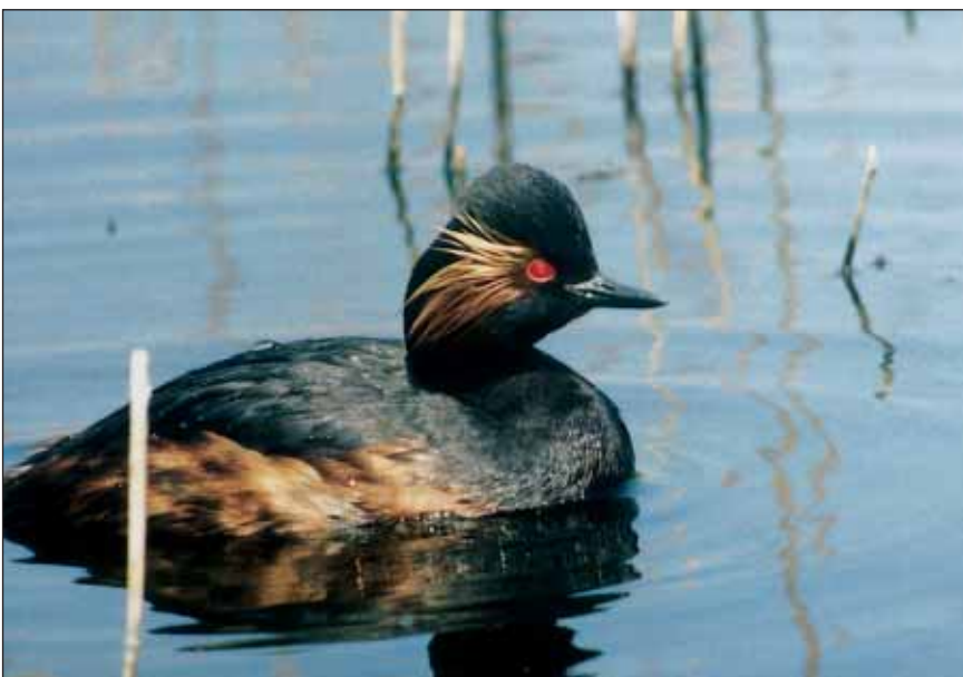
Geoorde Fuut Podiceps nigricollis

standplaats gelegen aan de noordoostelijke hoek. Activiteiten werden opgenomen volgens de methode van Altman (1974) voor twee afzonderlijke reeksen: individueel voorkomende vogels en vogels in groepsverband. Elke reeks is verder onderscheiden in vijf klassen: 1) hoog actieve vogels, zoals vogels die voedsel zochten op het wateroppervlak of die gescreend werden even voor of na een duikpartij ('kop hoog', hals gerekt), 2) rustende of slapende vogels ('kop laag', hals ingetrokken), 3) vederschikkende, 4) duikende vogels en 5) vogels betrokken in een conflict. Door luchtzinderingen bleek