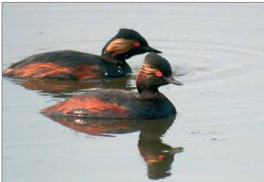
Geoorde Futen Podiceps nigricollis

gedrag van slagpenruiers, zodat onze waarnemingen moeilijk een vergelijking vinden.