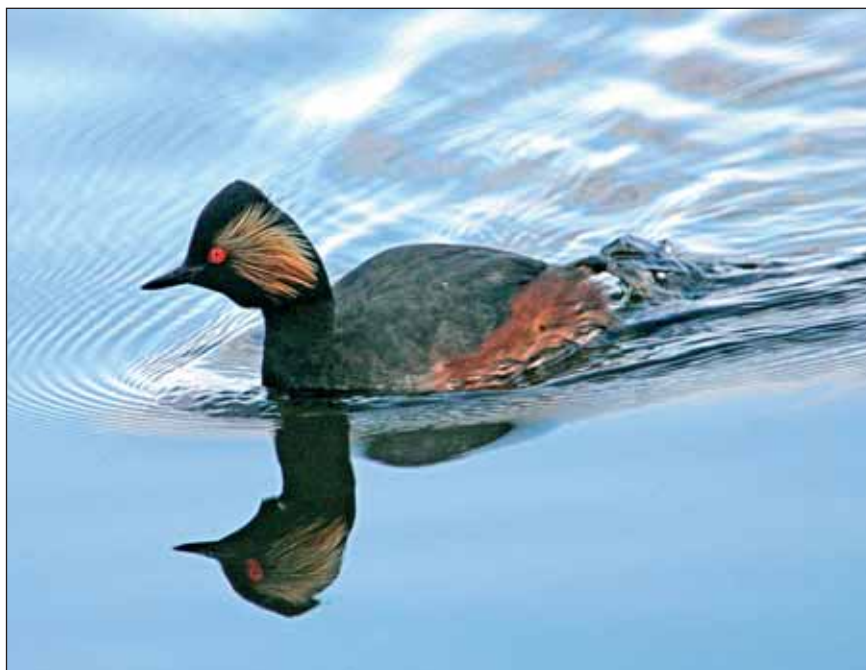
Geoorde Fuut Podiceps nigricollis

Het ruien van de slagpennen is bij Geoorde Futen moeilijk te zien van op afstand. Het nogal egaal lichtgrijs achterdeel van de romp en de concentratie van vogels tot dichte groepen zijn geen betrouwbare kenmerken. Het veelvuldig verenpluizen kan ook in verband staan met de rui van het kleingevederte van zomer- naar winterkleed en is niet kenmerkend voor slagpenrui. Het